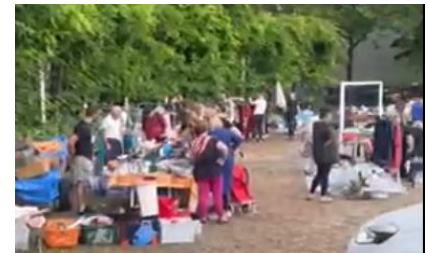
Le vide grenier fin 2024, réalisé dans la plus grande cour au sein des 26 immeubles, a connu un vif succès.