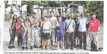
Légende de la photo « Créée début juin, l'asso AJG compte déjà un noyau dur d'une quinzaine de membres »