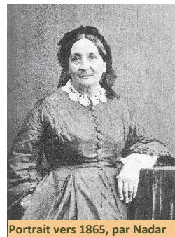
Portrait vers 1865

A 26 ans, en 1822, Eugénie se marie avec Paul-Louis Niboyet, avocat. Le couple s'établit à Mâcon où naît en 1825 Paulin, leur fils unique. Puis en 1829, Eugénie s'installe à Paris. Séparée de son mari en 1836, et ne disposant d'aucune fortune, elle se tourne vers l'écriture pour gagner sa vie : traductions de livres de Dickens, essais, romans... La voilà témoin des nombreux bouleversements politiques turbulents du XIX e siècle : 2 empereurs, 3 rois, 2 Républiques !!