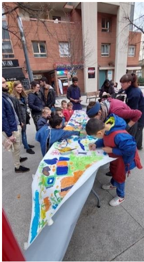
← Avec Arts et Développement, « Comme elle est belle, notre grande fresque ! » ↑