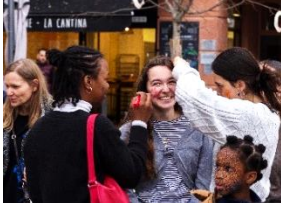
← Maquillages de fête ! ↓