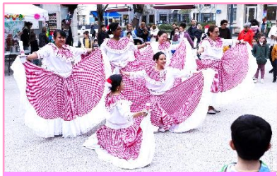
Ravissantes danseuses de Folclor Amazonia