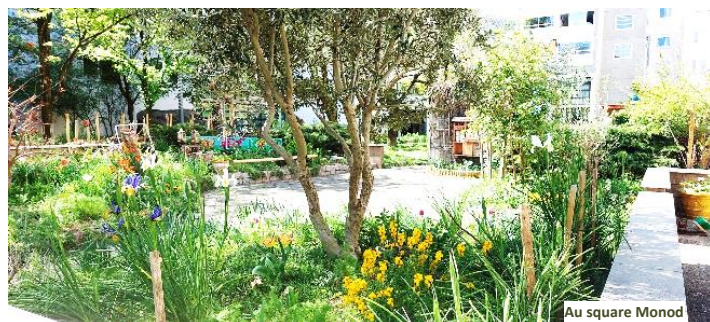
Au square Monod