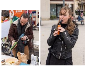
« Courgette ou carotte, je vous fabrique une flûte musicale ! »