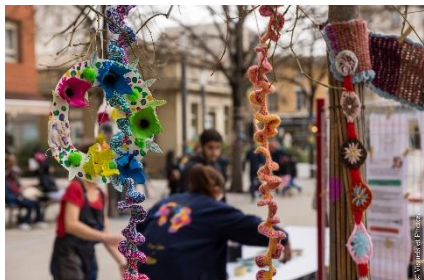
Art unique à Lyon, les fleurs multicolores en laine, par le groupe « Place au crochet ».