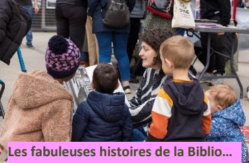
Les fabuleuses histoires de la Biblio...