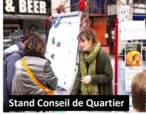
Stand Conseil de Quartier