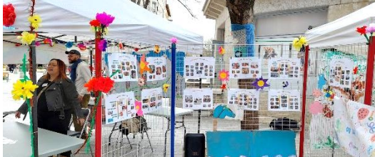
↑ Coordinateur de la fête Prin' Time, le Centre Social est là pour accueillir, proposer des jeux, fabriquer des fleurs, faire sentir des fleurs et des plantes, offrir un chocolat ou une très bonne chorba, à la nuit tombée... →