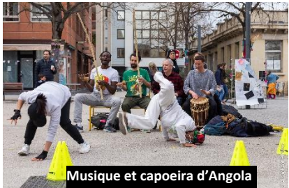
Musique et capoeira d'Angola