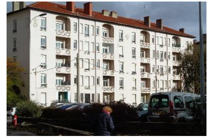
A g., façade Cité-Jardin typique 178 rue de Gerland. Ci-dessus, au 1 et 3 rue Benjamin-Delessert.