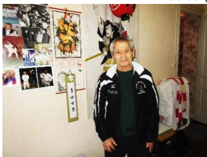
Natch chez lui, Cité-Jardin, dans sa pièce d'entraînement, son kimono blanc bien plié, le 9/1/2024.

En témoignage aussi cette sculpture de fers à béton (ci-dessus) installée à l'intérieur de l'école, qui rend hommage aux travailleurs de chez Mûre.