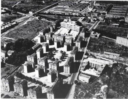
La Cité-Jardin, bordée à g. par le parc du "château" et des champs, par l'école A. Briand en blanc avec au-dessus les abattoirs, et à dr. par la rue Challemeil-Lacour sans arbres (+ cité marchande et école de rééducation)

Elle est au sud de Gerland. Construite en 4 îlots, la cité se situe entre l'avenue Jean-Jaurès (joutant l'école A. Briand) à l'ouest et la rue de Gerland à l'est. Sa partie nord longe la rue Challemeil-Lacour tandis que sa partie sud se termine rue B. Delessert et au parc boisé du "château" de Gerland.