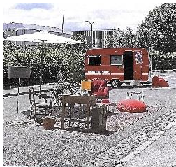
L'EAU POUR PRENDRE SOIN DU 30 JUIN AU 02 JUILLET 2022 DEVANT LES BAINS-DOUCHES

Du 30 juin au 2 juillet, l'association LALCA s'est déployée devant les Bains-douches de la rue Delessert, à la Biblio de Gerland puis sur les quais du Rhône à la Guillotière (lors de la Fête de l'eau, le 2 juillet). Organisant l'installation d'un sauna populaire et massage, une distribution du savon de Gerland et boissons chaudes gratuites, proposant des lectures et jeux, du théâtre ainsi que l'installation visuelle et sonore de récits ( lire extrait ci-dessous ).