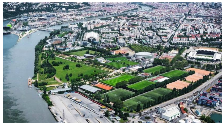
GERLAND : au 1er plan à g., le Rhône avec l'arrivée de la Saône et le quartier Confluence. Au sud de la photo, le port E. Herriot (mis en service en 1938). Au-dessus à g., le parc de Gerland (1996), la plaine de jeux (inaugurée en 1973, avec 8 terrains de foot, 2 de rugby, tennis, boxe, athlétisme ...) et la Tony Parker Academy. Plus haut de g. à dr., la Cité Scolaire Internationale (1992), la Halle Tony-Garnier (1914), le Palais des Sports (1957) et le stade de Gerland (1926). Entre ces 2 derniers grands équipements sportifs démarre (un peu en biais) l'avenue Jean-Jaurès (percée en 1908).