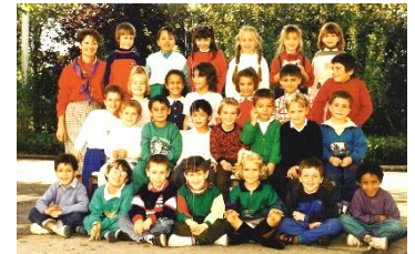
Ci-contre, classe de CP en 1973 et ci-dessus, les CP en 1983