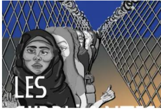
Veduta - l'art, la ville, les habitant.e.s

Les Suppliantes, une réécriture, avec Organon Art Cie à Lyon 7