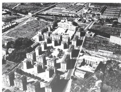
Au 1 er plan, la Cité Jardin, et dans son prolongement, le groupe scolaire A-Briand. Au loin, les 23 ha des abattoirs de (Lyon) la Mouche. Sur l'av. J-Jaurès, il n'y a de construits que la petite Halle au n° 283 et l'immeuble au n° 263-269.