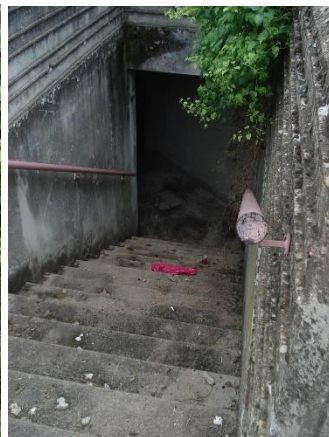
A g. pendant le ramassage par 4 personnes, et à dr l'escalier après.

« J'habite rue St Cloud à 100 mètres du parking, depuis 14 ans, écrit cet habitant ulcéré à la Mairie du 7 ème le 10 mai. Depuis 2007, j'ai vu les immondices s'entasser, sans qu'une seule fois les services de la voirie n'interviennent pour les évacuer. Et depuis 2 ans, ce parking sert de garage sauvage de réparation de camionnettes qui donnent à Gerland une réputation pittoresque et pitoyable. »