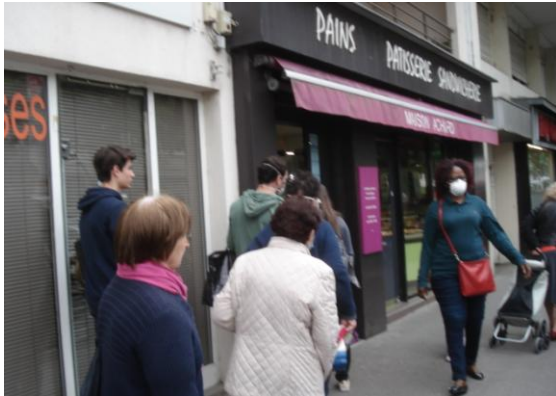
Devant la boulangerie-pâtisserie Achard, Photo 15/05/2020