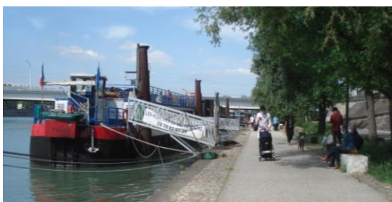
Sur les quais du Rhône, bien des gens masqués, et d'autres pas.

Où : rue Delessert, près des Bains et douches de Lyon et près de la Cité Jardin dans le 7 ème , à Gerland sud.