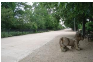
Personne, sauf un lion, sur cette grande allée du parc de Gerland (dans le prolongement de l'avenue Jean-Jaurès)