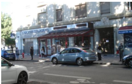
Pour aller au laboratoire d'analyses, Place Jean Macé, un queue de plus de 15 personnes !